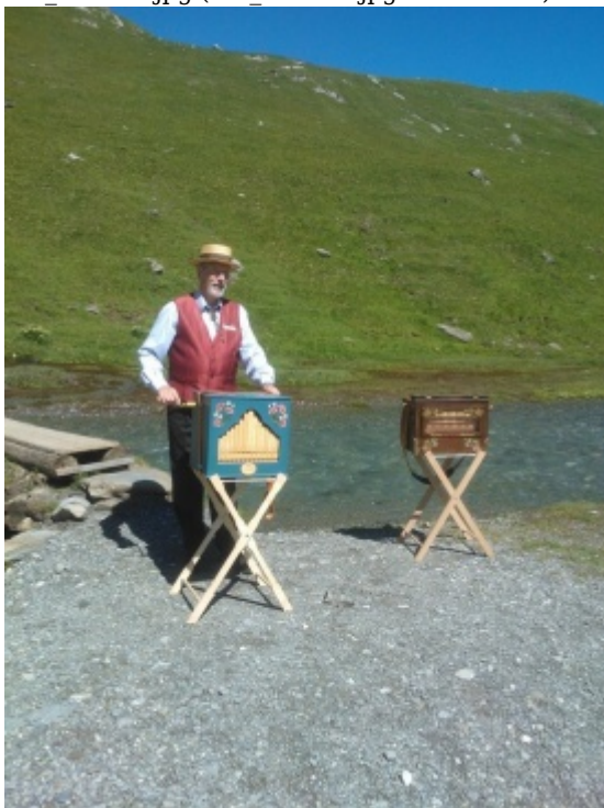
WP_000034.jpg (WP_000034.jpg 255.34 kB)