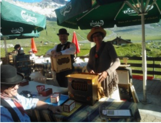
WP_000043.jpg (WP_000043.jpg 2630.03 kB)