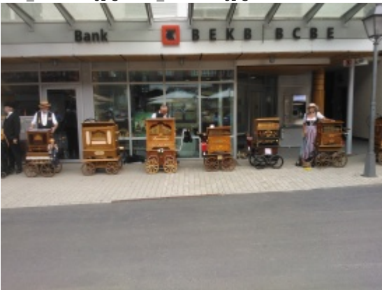
WP_000055.jpg (WP_000055.jpg 2559.64 kB)

http://www.drehorgel-schmid.ch/de/Bildergalerie?cid=7&pdfview=1&smallscreen=0