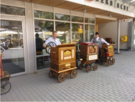
WP_000047.jpg (WP_000047.jpg 2688.34 kB)